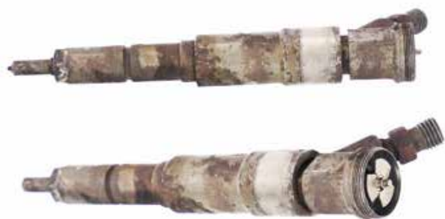
Rozebraný / nekompletní díl